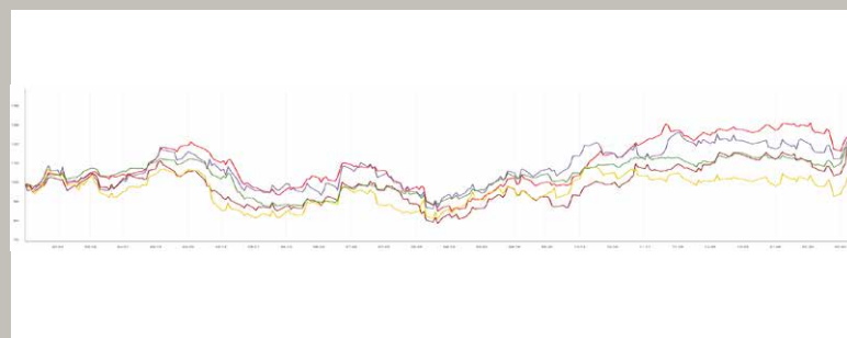
BPER Banca vs principali banche